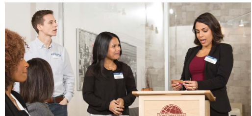
Table Topics. Durante los Table Topics (Discursos de Improvisación), todos los asistentes tienen la oportunidad de presentar discursos de improvisación de uno o dos minutos. Con frecuencia, esta es la parte más difícil y divertida de la sesión.

El orden y la duración de estos segmentos puede variar de un club a otro. La duración de la sesión del club a menudo determina la cantidad de tiempo que se destina a cada segmento.